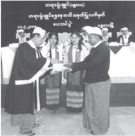
တရားရုံးချုပ်(ဓနုလေး) တရားရုံးချုပ်ရှေ့နေအသိအမှတ်ပြုလက်မှတ်ပေးအပ်ပွဲ

ရာ အခမ်းအနားသို့ တရားရုံးချုပ် (ဓနုလေး)မှ ဒုတိယတရားသူကြီးချုပ် ဦးခင်မောင်လတ်နှင့် တရားရုံးချုပ် တရားသူကြီးများ၊ ညွှန်ကြားရေးမှူးများ၊ ရှေ့နေချုပ်ရုံး ညွှန်ကြား