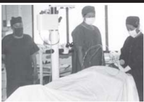
ဖြတ်ဖြူဆေးရုံကြီး စာမျက်နှာ - ၈