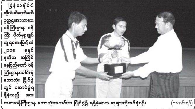
ကြေးမုံသတင်းစာ စာမျက်နှာ ၁၀