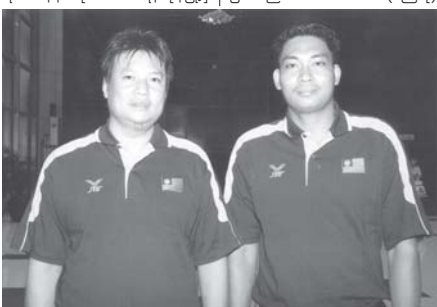
ရန်ကုန် စက်တင်ဘာ ၂၀