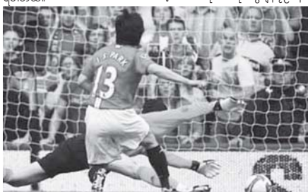
မန်ယူအတွက် ဦးဆောင်ဂိုးကို ကွင်းလယ်လူ ပက်ချီဆန် သွင်းယူနေစဉ်။

ဒုတိယပိုင်းမှာ ပွဲတောနဲ့ အိမ်ရှင် ချယ်လ်ဆီးတို့ဟာ ချွေပုဂ္ဂိုလ်ရေး အတွက် ဒီရောဘာကို ထည့်သွင်းပြီး မန်ယူဘက်ကို တရုတ်မီဒီယာပေး တိုက်စစ်ဆင်ကစားခဲ့ပါတယ်။ ၆၅ မိနစ်မှာဂျီကီးလ်က မန်ယူဂိုးသမား ကူဇနီနီ တစ်ဦးချင်းတွေ့ပြီး အနီးကပ် အပိုင်ကန်သွင်းခဲ့ပေမယ့် ဂိုးသမားကူဇနီက ကာကွယ်သွားနိုင်ခဲ့ပါတယ်။ ဒုတိယပိုင်းပွဲချိန် ၇၆ မိနစ်