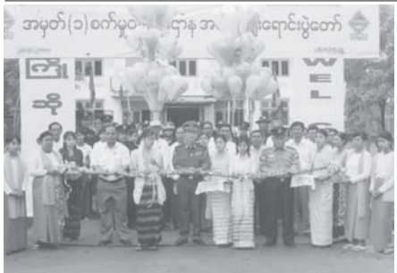
အမှတ်(၁)ဝက်မူဝန်ကြီးဌာန အထူးစေလွှတ်ပွဲ

အသင်း ဆုပေးလှူဒါန်းမှု ဝန်ကြီးထံ ဆုပြုပေးသော ကျပ် ၁၀ သိန်းကို ပြန်လည်ပေးအပ်