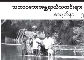
သဘာဝဘေးအန္တရာယ်သတင်းများ စာမျက်နှာ - ၅