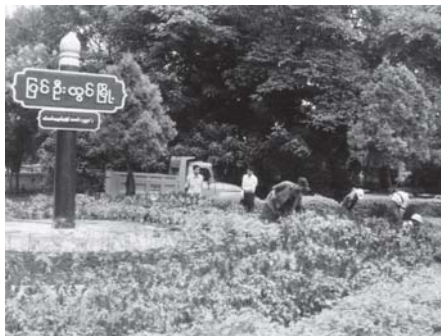
မြင်းစီးထွေးမြို့အဝင် ကျွန်းတိုင်အစိုင်း၌ ပန်းအလှပင်များ၊ ပုံဖော်ထားမှုတို့ လှပစွာတွေ့ရစဉ်။