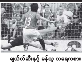
ချယ်လ်ဆီးနှင့် မန်ယူ သရေကစား စာမျက်နှာ - ၁၁

အကြမ်းဖက်သမားတွေကို ပြည်သူတစ်ရပ်လုံးက စက်ဆုပ်ရွံရှာ မုန်းတီးနေကြတာ အမှန်ပါပဲ။ လူသစ်၏ “အကြမ်းဖက် အဖျက်သမားအန္တရာယ် ပြည်သူ့အားနဲ့ ဝိုင်းဝန်းပူးပေါင်းကာကွယ် (၁)” (ဆောင်းပါး) စာမျက်နှာ - ၆