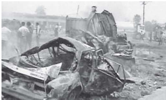
အီရတ်စ်နိုင်ငံတွင် အသေခံ ငိုကြွေးနေသော အာဖဂန်လူမျိုးတို့၏ အိမ်အနီးတွင်