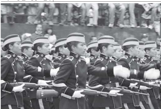
စက်တင်ဘာ၁၆ရက်က မက္ကဆီကိုနိုင်ငံ လွတ်လပ်ရေးနေ့ အခမ်းအနားတွင် အမျိုးသမီးတပ်ဖွဲ့ဝင်များ စစ်ရေးပြဆိုက်ကနေသည်ကို တွေ့ရစဉ်။