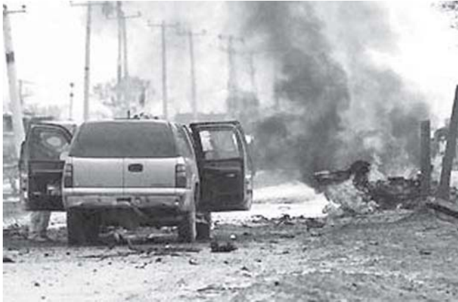
အာဖဂန်နစ္စတန်နိုင်ငံ ကဘူးမြို့တွင် အမေရိကန်တပ်ဖွဲ့၏ လုံခြုံရေးယာဉ်တန်းအနီး ငှားခဲ့တိုက်ခိုက်မှု ဖြစ်ပွားခဲ့သည်ကို တွေ့ရစဉ်။