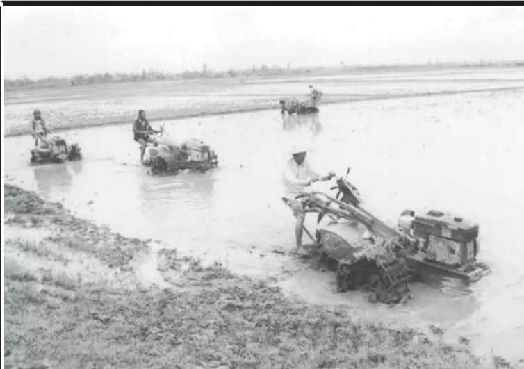
စက်မှုလယ်ယာဦးစီးဌာနမှ လယ်ယာသုံးစက်ကိရိယာများကို အသုံးပြု၍ လပွတ္တာမြို့နယ်မှ တောင်သူလယ်သမားများ လယ်ယာလုပ်ငန်းခွင်တွင် ထွန်ယက်နေစဉ်။