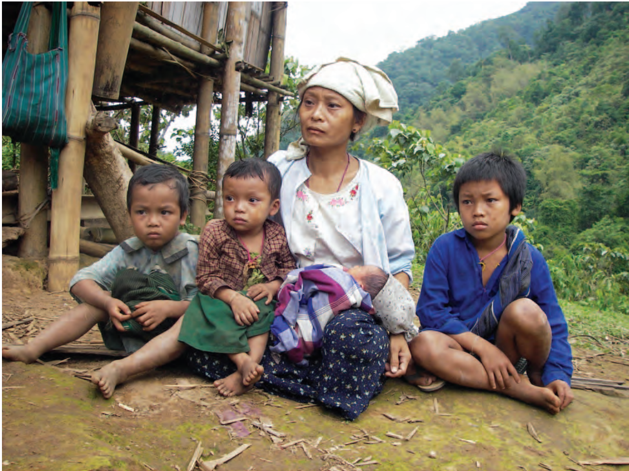
တၢ်ဂီၤအံၤ ဘၣ်တၢ်ဒီးန့ၢ်အီၤဖဲ လၢမ့ၢ် ၂၀၀၆ နံာ် ဖဲလုာ်သီကီၢ်ဆၢ, မ့ၢ်တြၢ်ကီၢ်ရၢာ်အပူၤန့ာ်လီၤ. တၢ်ဂီၤအံၤဟံၤဖျါဖဲ မုာ်ကမဲတဂၤ ဒီးအဖိလွံာ်ဂၤလၢ တၢ်ယုာ်အိၣ် ကမ့ၢ်အလီၢ်တတီၢ်န့ာ်လီၤ. ပိာ်မုာ်အံၤအဝၤန့ာ် ပယီၤသးတဖၣ် ခးသံကွံာ်အီၤ ဖဲ ၂၀၀၆ နံာ်အခါန့ာ်လီၤ.

ဖဲ ၂၀၁၅ နံာ် တာ်ဆဲးလီၤဖဲ ထံကီၢ်ဒီဘုာ်တၢ်ပတုာ်တၢ်ခးအလံာ်ယံးယာ် (NCA) န့ာ် ဇးအိၣ်ထီၣ်ဖဲ တၢ်ဆိတလဲအဂ့ၤတနီၤန့ာ်လီၤ. ဒ်တၢ်မၤတၢ်မုာ်တၢ်ခုာ်အကျိၤအကျဲအံၤ အိၣ်ကတၢ်ထီၣ်အသး လၢဆၢကတီၢ်ခဲအံၤအသး တၢ်ကဘျါၣ်တၢ်မၤပယုဲပုၤဟီၣ်ခိၣ်ဖိ ခွဲယာ်လၢအပူၤကွံာ် လၢအမုာ်တၢ်စံာ်စိၤအအာ်တဖၣ် ဒီးတၢ်မၤပယုဲလၢကကဲထီၣ်သးအသီတဖၣ် လၢကီၢ်ပယီၤမုာ်ထီၣ်ကလံာ်ထံးအပူၤ တုၤအပတီၢ်ဆံးအါလဲၣ်န့ာ် တၢ်တသ့ညါအီၤဖျါဖျါဖျါဒီးဘၣ်န့ာ်လီၤ. နီၢ်နီၢ်တခါ, တၢ်မၤပယုဲလၢအပူၤကွံာ် အတၢ်ပိာ်ထွဲထီၣ်အခံ သ့တဖၣ် မၤဘၣ်ဒီးဒီးဒ်လီၤကဝီၤဖိတဖၣ်အတၢ်အိၣ်မူကိးနီၤဒီး ဒီးတကးဒီးဘၣ် တၢ်မၤပယုဲအက့ၢ်ဂီၤလၢအသီတဖၣ်စ့ၢ်ကိး မၤဘၣ်ဒီး လီၤကဝီၤဖိတဖၣ် အတၢ်လုာ်အိၣ်သးသမူ အမုာ်ကျိၤဝဲၤကွံာ်ဒိၣ်မးန့ာ်လီၤ. လၢတၢ်န့ာ်အယိ ပုၤလၢအတူၢ်ဘၣ်တၢ်မၤပယုဲပုၤဟီၣ်ခိၣ်ဖိ ခွဲယာ်တဖၣ် ကဒီးန့ၢ်ဘၣ်တၢ်တီၢ်တြၢ်ဒီးစ့အိၣ်လိး လၢအမၤဘၣ်လီၢ်ဘၣ်စးက့ၤအဝဲသ့အတၢ်အိၣ်မူန့ာ် မ့ၢ်တၢ်လၢအရဲဒိၣ်ဒိၣ်မးန့ာ် လီၤ. တၢ်ဘၣ်ယိၣ်ဘၣ်ဘျီတဖၣ် ဘၣ်တၢ်ဘျါၣ်အီၤတုၤလီၤတီၤလီၤအိၣ်တအိၣ်န့ာ် ထဲဒ်ပုၤကမျါၢ်လၢအတူၢ်ဘၣ်တၢ်တဖၣ် ဆၢတၢ်ဝဲသ့န့ာ်လီၤ.