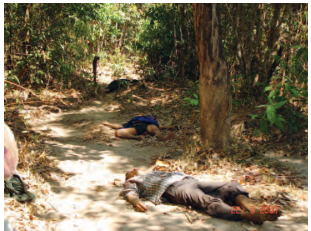
တံးဂီၢ်အံၤဟ်ဖျါထီၣ်ဝဲ သဝီဖိတဖၣ်လၢဘၣ်တံးခးသံအီၤလၢ ပယီၤသုးလၢကျဲ ဖဲဖျါဒုးဒီးသးဒါဟီၣ်ကဝီၤ. မုၢ်တြီကီၢ်ရၢၣ် ဖဲ ၂၀၀၇ နံၣ် လၢမးရး ၂၁ သီအနံၤန့ၣ်လီၤ. (တံးဂီၢ်- KHRG)

အဆာဒ် (က) – တံးကွံာ်ကဒါကွၢ် အံၤဟ်ဖျါထီၣ်ပယီၤသုး အတံးဟဲန့ၣ်ဒုးထီၣ်ကညိသဝီဖိတဖၣ်လၢ အကျါအကျဲလီၤတံး လီၤဆဲးအပူၤ ဒီးဆီၣ်တံးမၤနၢၤဒုးကဲထီၣ်ကမျါလၢအအိၣ် လၢတံးဒုးကဲထီၣ်သးဟီၣ်ကဝီၤတဖၣ်ဆူ တံးမပယွဲပဟ်ဒ်ခိပ်ဖိ ခွဲးယံအါအါဂီၢ်ကီၢ် ဒ်တံးအကါဒ်တမံၤန့ၣ်လီၤ. တံးမပယွဲတဖၣ် အံၤပၣ်သုးဒီး တံးမၤသံမၤဝီ, တံးမၤဆါပယွဲ, တံးမၤလၢအတ လီၤကၢ်ပုၤကူပုၤကညိ မ့တမ့ တံးမၤလၢအလၢကဝီၤတအိၣ်, တံးသုးမုၢ်/ခွါ တံးမၤတရီတပါထီၣ်ပိာ်မုၢ် ဒ်တံးဒုးအစုကဝဲၤ တမံၤဒီး ဒ်တံးမၤဟးဂီၢ်တံးစုလီၤခိပ်ခိပ်တမံၤအသီးန့ၣ်လီၤ. ပယီၤ သုးစုးကါပုၤကမျါတဖၣ် ဒ်ပဟ်တံးဖိလၢတံးတဟ့ၣ်အီၤအဘူး အလဲ, တံးသုးအီၤလၢသုးဂ့ၢ်ဝီတံးပညိၣ်အဂီၢ်, ဆီၣ်တံးမၤနၢၤ ပဟ်တူၢ်ဘၣ်တံးတဖၣ်လၢတံးစုဆူၣ်ခိပ်တကး ဒီးတံးမၤပျါမၤဖုး လၢကဲထီၣ်သးသမူ အတံးလီၤဘၣ်ယိၣ်ဒ်လဲာ်န့ၣ်လီၤ. ပယီၤသုး တဖၣ်မၤစုာ်ကီးဝဲ တံးဂုာ်ဆူၣ်ပျါဆူၣ်တံး, တံးယုးန့ၣ်ဆူၣ်တံးဒီး မၤသ ကိးတံးဒီးကီၢ်ပယီၤပဒ်အတံးကရၢကရီတဖၣ်လၢ တံးဟံးန့ၣ်ဆူၣ် ဟီၣ်ခိပ်ကပံာ်န့ၣ်လီၤ.