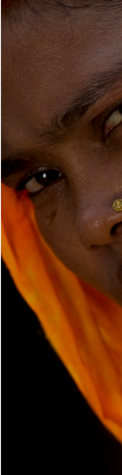
"F.Z.," 25. Cox's Bazar, Bangladesh, ဩဂုတ်လ ၂၀၁၉။