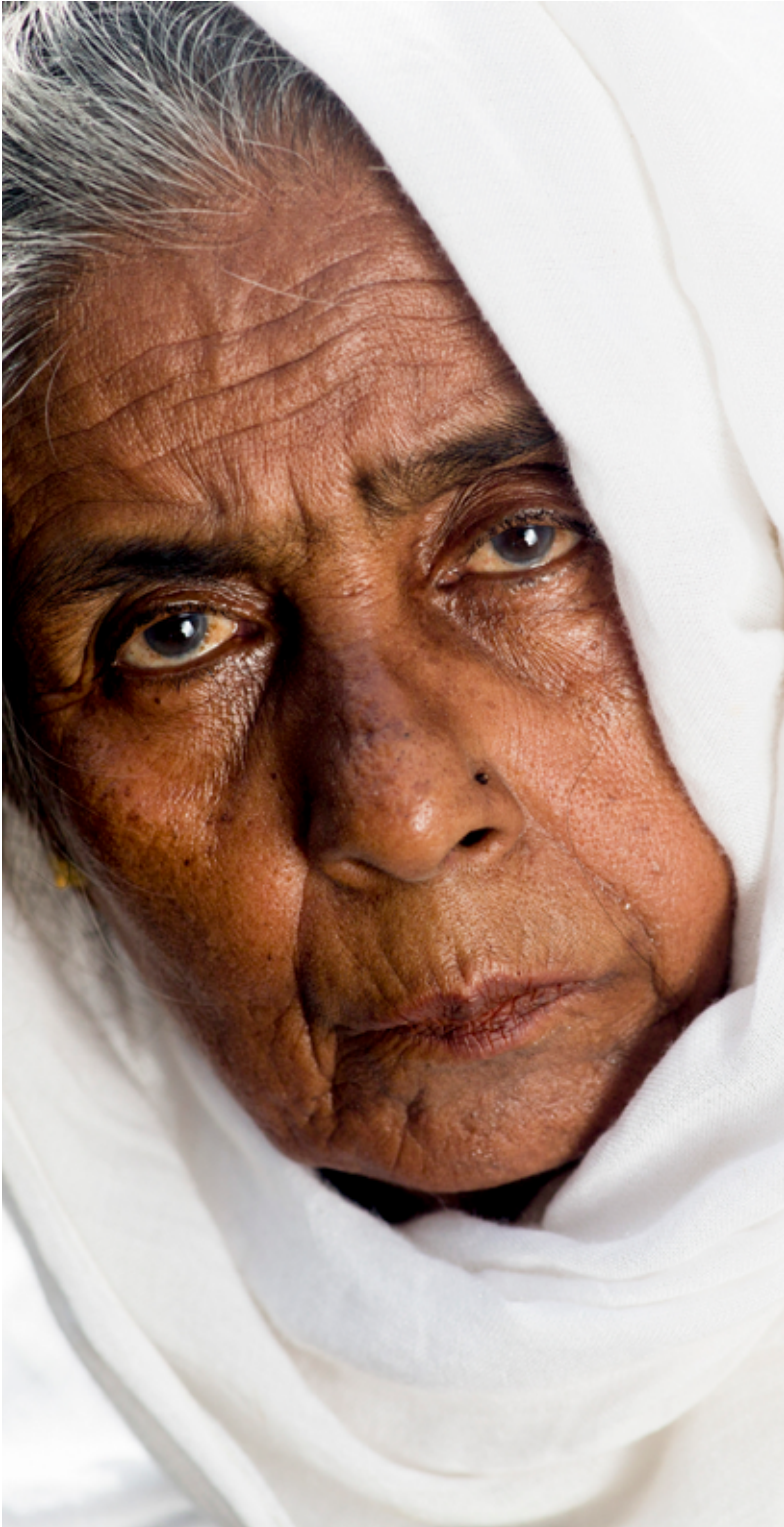
H.K., 75. ©Saiful Huq Omi, Counter Foto, Cox's Bazar, Bangladesh, ဩဂုတ်လ ၂၀၁၉။