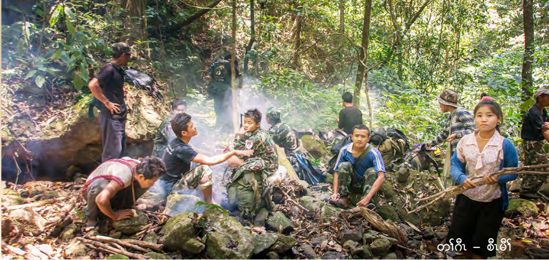
တၢ်ဂီၤ - စိမိာ်