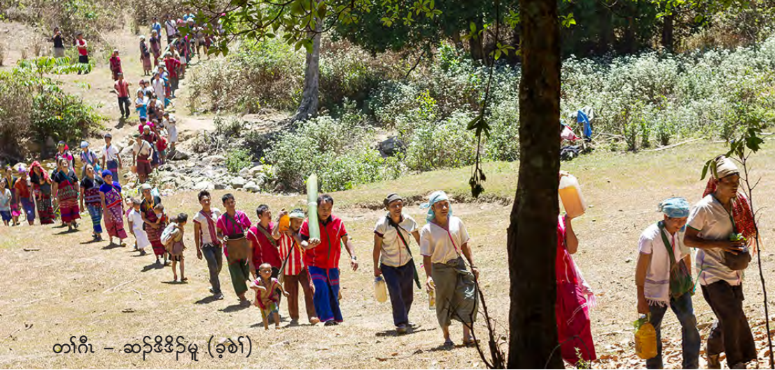
တၢ်ဂီၤ - ဆၢၣ်ဒီးဒိၣ်မူ (ခုစၢ်)