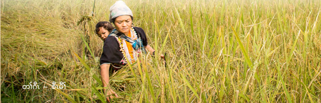
တၢ်ဂီၤ - စိမိာ်