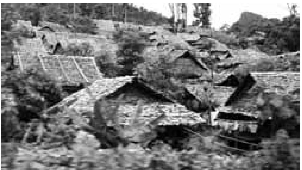
ဘိန်းမဲညှဲး ဖမ်းဆီးရရှိသည့် မယ်လဒုက္ခသည် စခန်း

ဇူလိုင်လ ၁၃ ရက်၊ ၂၀၁၂ ခုနှစ် စောခါးစူးညား (ကေအိုင်စီ)