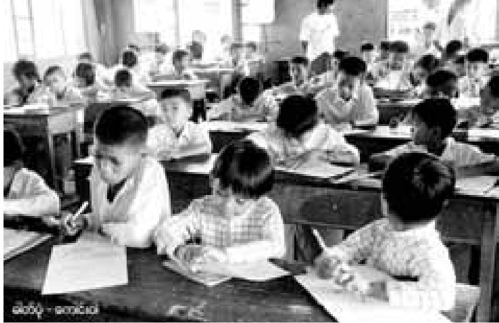
ရုရှား၊ ၂၀၁၂ ခုနှစ်၊ နန်းယဉ်

မွန်စာပေကို ကျောင်းချိန်ပြင်ပ ယဉ်သာ သင်ကြားပေးပြီး ၎င်းအတွက် ပညာရေးထောက်ပံ့ကြေးပေးဆောင်သွားမည်ဟု သမ္မတဦးသိန်း