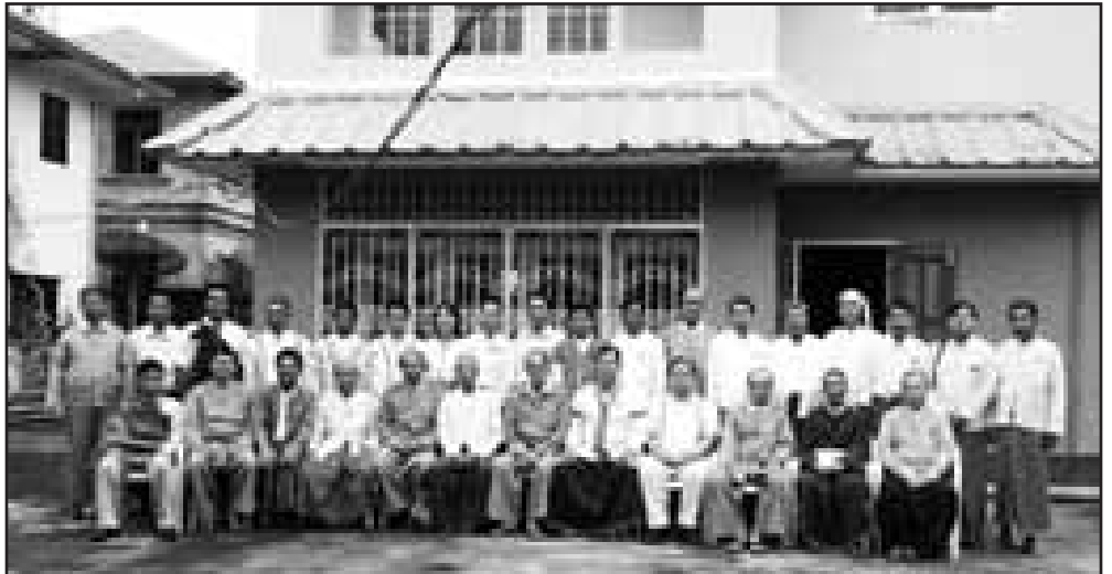
တိုင်းရင်းသားညီနောင်(၅)ပါတီမှ ပါတီဝင် ကိုယ်စားလှယ်များ

ငြိမ်းချမ်းရေး ဖော်ဆောင်မှုကော်မတီကို ဖွဲ့စည်းခဲ့သော တိုင်းရင်းသားညီနောင်ပါတီ မြေမှာ ရှမ်းတိုင်းရင်းသားများ ဒီမိုကရက်တစ်ပါတီ၊ ဖလုံ-စတီဒီမိုကရက်တစ်ပါတီ၊ ချင်းအမျိုးသားပါတီ၊ ရခိုင်တိုင်းရင်းသားများ တိုးတက်ရေးပါတီ၊ မွန်ဒေသလုံးဆိုင်ရာ ဒီမိုကရေစီပါတီနှင့် ကယန်းအမျိုးသားပါတီတို့ ဖြစ်သည်။