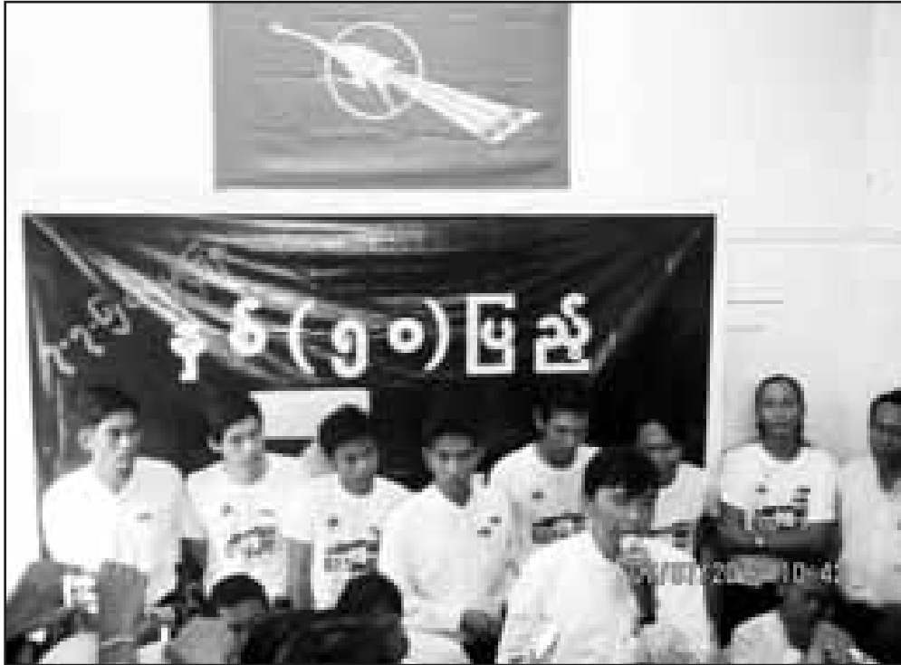
ဆဲပင်းဂူလိုင် နှစ် (၅၀)ပြည့် အခမ်းအနား ကျင်းပနေကြသော ရေကျောင်းသားခေါင်းဆောင် ကိုမင်းကိုနိုင်နှင့် မျိုးဆက်သစ်ကျောင်းသားများ