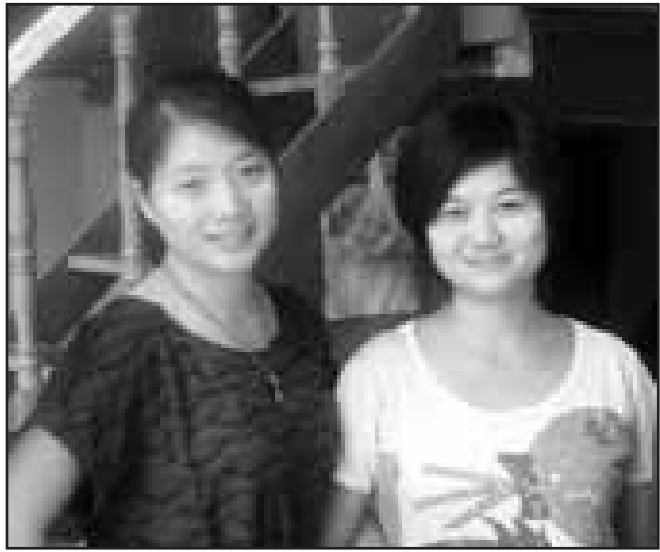
လမ်းခရီးတွင် ပျောက်ဆုံးသွားသော လီဆူအမျိုးသမီးနှစ်ယောက်

ဇူလိုင်လ ၃ ရက်၊ ၂၀၁၂ ခုနှစ်၊ နော်ဆဲကလယ် (ကော့ဒိုင်စီ)