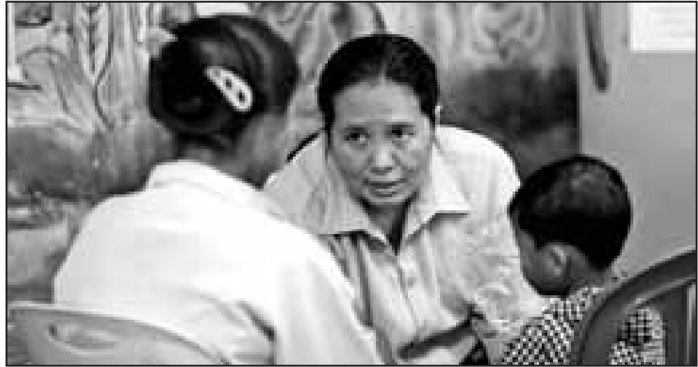
ဆရာမစင်သီယာမောင်ထံသို့ ရောဂါလာပြသော လူနာတစ်ဦး

၂၀၁၀ ခုနှစ်နှင့် နှိုင်းယှဉ်လျှင် ၂၀၁၁ ခုနှစ်တွင် ပြင်ပ ကလေးလူနာ ၂,၁၀၀ ဦးကျော် လျော့နည်းသွားပြီး ၁၃ ရာခိုင်နှုန်း ဖြစ်သည်။ ကလေးအတွင်းလူနာသည်လည်း ၄၉၀ ဦးကျော် လျော့နည်းသွားပြီး ၂၇ ရာခိုင်နှုန်းဖြစ်ကြောင်း မယ်တော်ဆေးခန်း၏ ၂၀၁၁ ခုနှစ်၊ နှစ်ချုပ်အစီရင်ခံစာတွင် ဖော်ပြထားသည်။