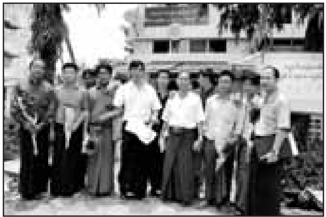
ပြန်လည်လွတ်မြောက်လာသော နိုင်ငံရေးအကျဉ်းသားများနှင့် စေတနာ့ဆန်ခေါင်းဆောင်များ

ဇူလိုင်လ ၃ ရက်၊ ၂၀၁၂၊ အိုင်စီအိုင် နိုင်ငံတော်သမ္မတဦးသိန်းစိန်က ယနေ့ ပြစ်ဒဏ်လွတ်ငြိမ်းချမ်းသာခွင့်ပေးသော နိုင်ငံသား အကျဉ်းသားများစာရင်းတွင် ကရင်တိုင်းရင်းသား ၃ ဦး ပါဝင်ပြီး အင်းစိန်ထောင်မှ ပြန်လည် လွတ်မြောက်လာသူများဖြစ်