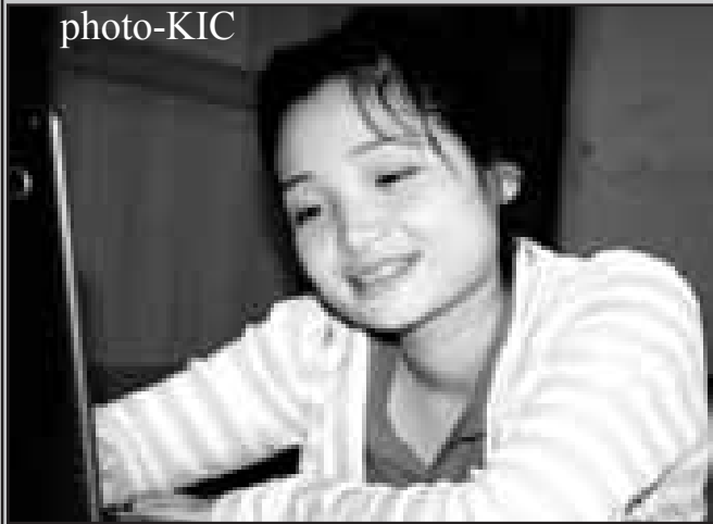
နော်မုဒါး - ၂၁ နှစ် ပညာအရည်အချင်း - ဆယ်တန်းလွန်ကျောင်း (Post Ten) ဝါသနာ - လူထုအခြေပြုလုပ်ငန်း

KIC - ဒါဆိုမယ်တော်ဆေးခန်းက ပညာရေးကော၊ ကျန်းမာရေးမှာ ထိုင်းပညာရေး၊ ကျန်းမာရေးဌာနတွေနဲ့ ဘယ်လို ပူးပေါင်းလုပ်ဆောင်နေတာ