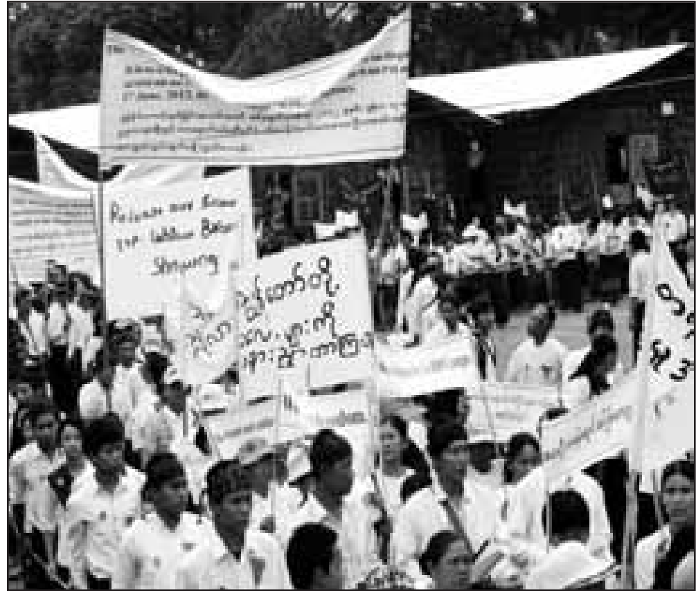
ဆန္ဒပြနေကြသော ဒုက္ခသည်စခန်းမှ ကချင်တိုင်းရင်းသားများ