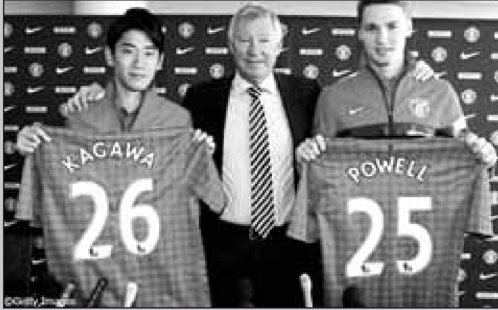
ကစားသမားအသစ်များနှင့်အတူ တွေ့ရသော မန်ယူအသင်းနည်းပြ ဖာဂူဆန်

မန်ယူအသင်း တောင်အာဖရိကတွင် အမာဇူးလူး၊ အေဂျက်စ် ကိပ်တောင်းအသင်းများနှင့် ရင်ဆိုင်မည်ဖြစ်ပြီး ထို့နောက်တွင် မူတသုတ် နိုင်ငံသို့ ဦးတည်ကာ ရှန်ဟိုင်းဆင်ဟွာနှင့် ခြေစမ်းရန် စီစဉ်ထားသည်။