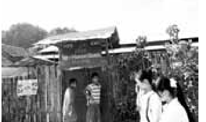
နို့ဖိုးဒုက္ခသည်စခန်းမှ သူနာပြုကျောင်းတစ်ခု

ဇူလိုင်လ ၁၇ ရက်၊ ၂၀၁၂ ခုနှစ် (ကေအိုင်စီ)