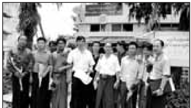
ထံးကီၢ်ဖိပူၤပာ်ဖိလၢအဟးထီၣ်ဘဉ်ပာ်ဖိပူၤအဂ့ၢ်ပာ်ပာ်ဒီးကညီကမျာ်