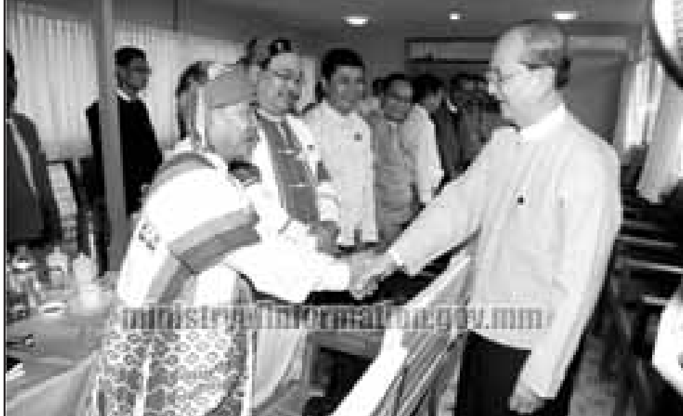
သမ္မတ ဦးသိန်းစိန်နှင့် ဒီမိုကရေစီ ၁၀ပါတီ ရင်းရင်းနှီးနှီး တွေ့ဆုံကြစဉ်

ရုလိုင်လ ၁၈ ရက်၊ ၂၀၁၂ ခုနှစ်၊ နန်းယဉ် (ကေအိုင်စီ) နိုင်ငံတော်သမ္မတဦးသိန်းစိန်နှင့် ဒီမိုကရေစီ မဟာမိတ် ၁၀ပါတီမှ ခေါင်းဆောင်များ ယနေ့ နံနက်ပိုင်းတွင်နေပြည်တော်ရှိ သမ္မတအိမ်တော်တွင် ပထမအကြိမ် တွေ့ဆုံဆွေးနွေးခဲ့ကြရာ တိုင်းရင်းသားဒေသမှ လိုအပ်ချက်များကို တင်ပြဆွေးနွေးခဲ့ကြသည်ဟု သိရသည်။ တွေ့ဆုံပွဲတွင် တိုင်းရင်းသား နိုင်ငံရေးပါတီ အသီးသီးက အဓိက တိုင်းရင်းသားဒေသ ပြရန်၊ တိုင်းရင်းသားလူမျိုးများ ပြရန်နှင့် တိုင်းရင်းသားဒေသအတွင်း ရသင့်ရထိုက်သည့် အခွင့်အရေးများနှင့် ပတ်သက်ပြီး တင်ပြဆွေးနွေးခဲ့ကြောင်း ချင်းအမျိုးသားပါတီ ဥက္ကဋ္ဌ ဦးစိုဇော်က ပြောသည်။