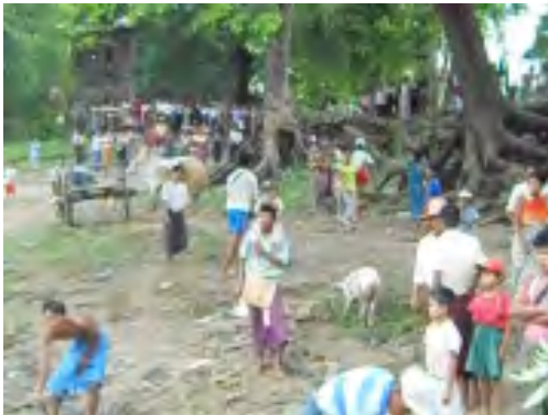
လယ်သမားအခွင့်အရေးကာကွယ်စောင့်ရှောက်သူများကွန်ယက်