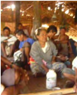
ဒေါ်တုတ်တုတ်