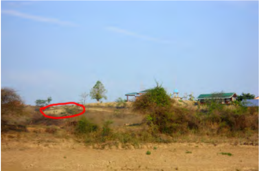
လယ်သမားများအား လုပ်ကြံရိုက်နှက်ခဲ့သည့် နေရာ