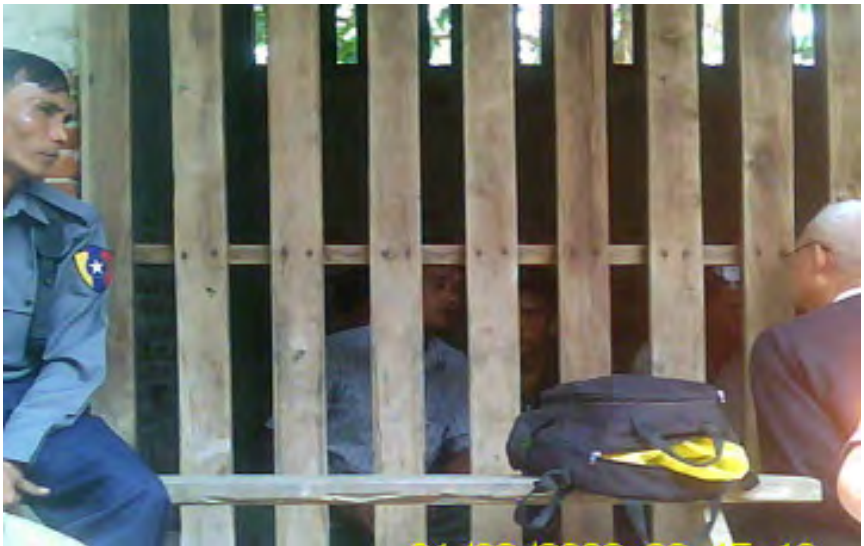
လုပ်ကြံခံရသော လယ်သမားများအား ကံမ တရားရုံးအချုပ်ခန်းထဲတွင် ချုပ်နှောင်ထားစဉ်

လယ်သမားအခွင့်အရေးကာကွယ်စောင့်ရှောက်သူများကွန်ယက်