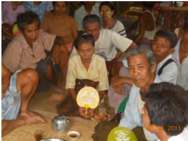
လယ်သမားအခွင့်အရေးကာကွယ်စောင့်ရှောက်သူများကွန်ယက်