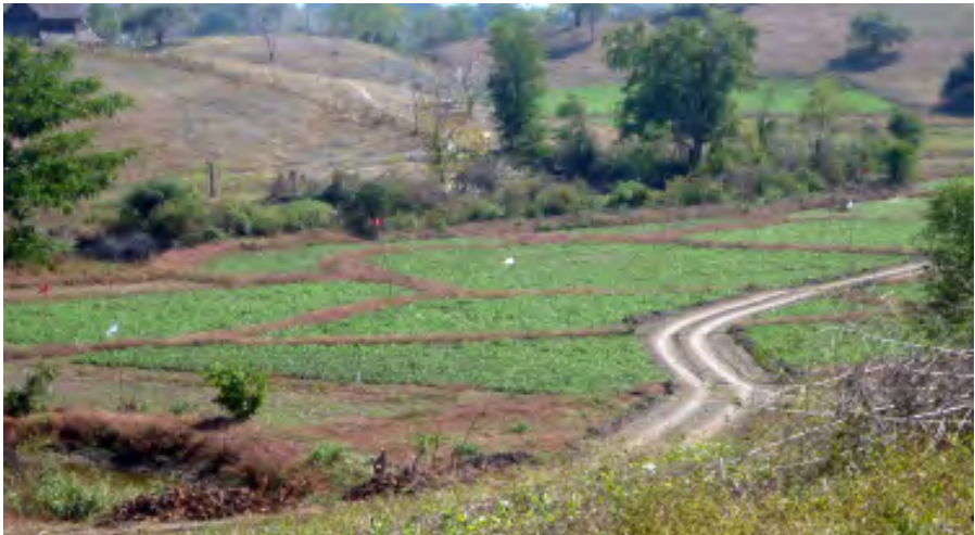
ပဲခင်းများအတွင်း ဖြတ်သန်းဖောက်လုပ်ထားတဲ့ စီမံကိန်းလမ်း

လယ်သမားအခွင့်အရေးကာကွယ်စောင့်ရှောက်သူများကွန်ယက်