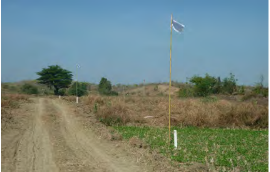
လယ်ယာမြေစိုက်ခင်းများပေါ်တွင် ထူးကုမ္ပဏီက ဤသို့ လမ်းဖောက်၍ အလံများ စိုက်ထူထား