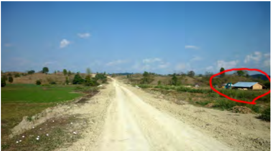
စိုက်ခင်းများအတွင်း အဆောက်အဦများ ကျူးကျော်ဆောက်လုပ်၍ စက်ပစ္စည်းများလည်း ထားရှိ

လယ်သမားအခွင့်အရေးကာကွယ်စောင့်ရှောက်သူများကွန်ယက်