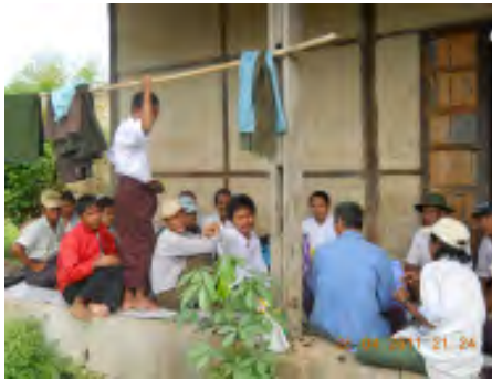
လယ်သမားအခွင့်အရေးကာကွယ်စောင့်ရှောက်သူများကွန်ယက်