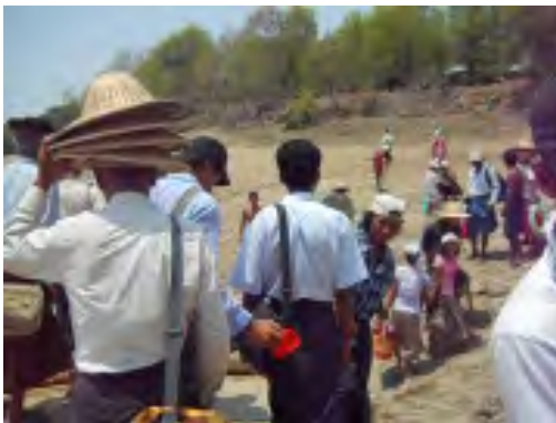
လယ်သမားအခွင့်အရေးကာကွယ်စောင့်ရှောက်သူများကွန်ယက်