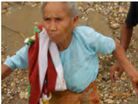
လယ်သမားအခွင့်အရေးကာကွယ်စောင့်ရှောက်သူများကွန်ယက်