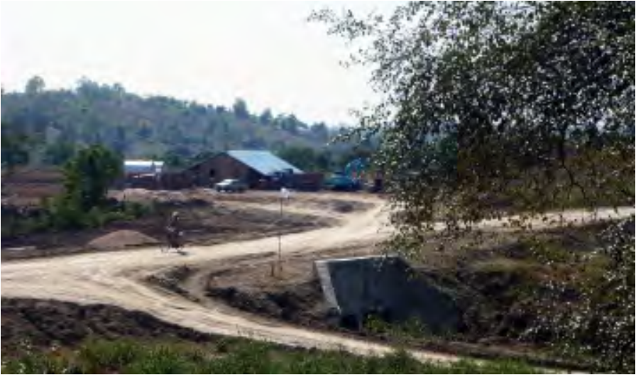
စီမံကိန်းဆောက်လုပ်ရေး အဆောက်အဦများက ဤသို့နေရာယူ