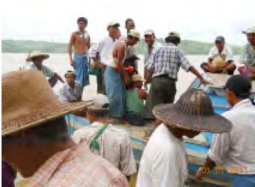
လယ်သမားအခွင့်အရေးကာကွယ်စောင့်ရှောက်သူများကွန်ယက်