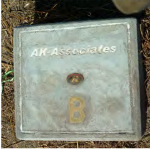
စက်ရုံဆောက်လုပ်ရန် လေ့လာဆန်းစစ်မှုများ ပြုလုပ်ခဲ့သည့် AK-Associates ကုမ္ပဏီတံဆိပ်ပါ မြေနေရာအမှတ်အသားတစ်ခု