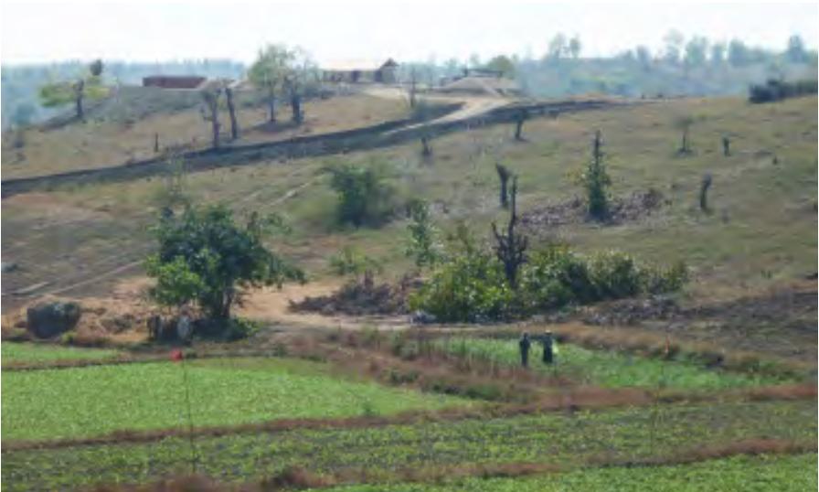
ပဲခင်းများနှင့် နွားစားကျက်များလည်း စီမံကိန်းဧရိယာထဲ ပါဝင်နေ

လယ်သမားအခွင့်အရေးကာကွယ်စောင့်ရှောက်သူများကွန်ယက်