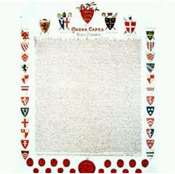
မဂ္ဂနာကာတာ စာချုပ်ကြီး (၁၂၁၅)

မဂ္ဂနာကာတာ စာချုပ်ကြီးမှာ ပစ္စည်းဥစ္စာပိုင်ဆိုင်ခွင့်ကို အကာအကွယ်ပေးတဲ့ ပြ ဌာန်းချက်တွေ၊ တရားစီရင်မှုကို စနစ်တကျဖြစ်စေမဲ့ ပြဌာန်းချက်တွေပါနေတာမို့ အဲဒီ ခေတ်အတွက်တော့ အတော်ကိုခေတ်မှီတဲ့ စာချုပ်ကြီးလို့ ပြောနိုင်ပါတယ်။ ဒါပေမဲ့ မဂ္ဂနာ ကာတာတာချုပ်ဟာ အင်္ဂလန်မှာ နေထိုင်သူတွေအားလုံးရဲ့ အခွင့်အရေးကို အကာအ ကွယ်ပေးတာမျိုးတော့ မဟုတ်ပါဘူး။ လူဂုဏ်ထံတွေအတွက်သာ မဂ္ဂနာကာတာတာချုပ် က အကာကွယ်ပေးပြီး သာမန်လူတန်းစားတွေ၊ အောက်တန်းစား လူတန်းစားတွေအ တွက် အကာကွယ်မပေးတဲ့အတွက် ဒီကနေ့ ပြောဆိုနေတဲ့လူသားအားလုံး ညီမျှမှုရှိရေး (equality) ဆို တဲ့မူနဲ့တော့ မကိုက်ညီပါဘူး။