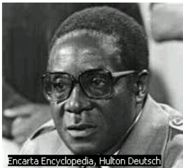
၁၉၈၀ ခုနှစ်ကတည်းက အာဏာ ရလာသူ လက်ရှိသမ္မတ ရောဘတ် မူဂါဘီ

ဇင်ဘာတွေမှာရှိတဲ့ လယ်ယာမြေအများစုကို လူနည်းစု လူဖြူတွေက ပိုင်ဆိုင်ထား တာမို့ လယ်ယာမြေ ပြန်လည်ဝေခြမ်းရေးအစီအစဉ်တစ်ရပ်ကို သမ္မတ မူကာဘီ အစိုးရက ၁၉၉၂ ခုနှစ်ကတည်းက ချမှတ်လုပ်ဆောင် ခဲ့ပါတယ်။ အစီအစဉ်အရ လူဖြူတွေပိုင်တဲ့ မြေ တွေကိုသိမ်းယူပြီး လူမည်းတွေကို ခွဲတမ်းချပေးရေးဖြစ်ပေမဲ့ အစိုးရအရာရှိတွေကိုသာ ခွဲ တမ်းချပေးတဲ့အချက်နဲ့ လွန်ခဲ့တဲ့နှစ်တွေအတွင်း လူမည်းတွေက လူဖြူမြေယာတွေကို အ တင်းဝင်ရောက်သိမ်းပိုက်နိုင်အောင် သမ္မတ မူကာဘီအစိုးရက အားပေးခဲ့တာတွေကို သမ္မတ မူကာဘီရဲ့ နိုင်ငံရေးကစားကွက်အဖြစ် အကဲခတ်တွေ့က ဝေဖန်ထောက်ပြခဲ့ပါ တယ်။