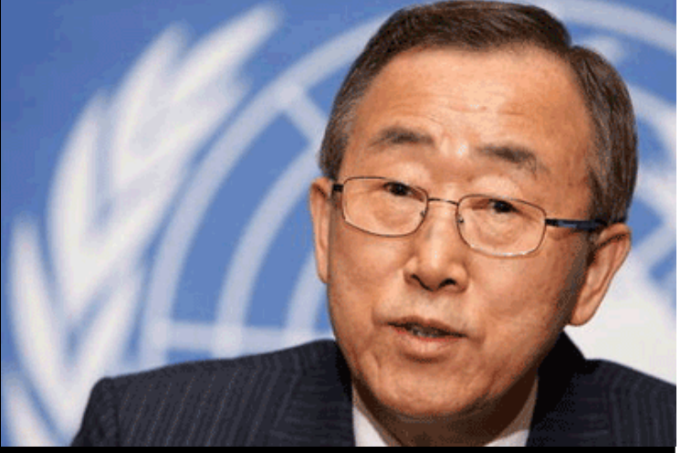
ကုလသမဂ္ဂ အထွေထွေအတွင်းရေးမှူးချုပ် မစ္စတာဘန်ကီမွန်း

ဆက်လက်၍ နိုင်ငံတကာ အသိုင်းအဝိုင်းမှ တောင်းဆိုနေသည့် ၂၀၁၀ ရွေးကောက်ပွဲအား နိုင်ငံရေးပါတီများ အားလုံးပါဝင်သည့် ရွေးကောက်ပွဲဖြစ်ရမည် ဆိုသည့်အချက်ပါဝင်ကြောင်းနှင့် ရှေ့ဆက်လုပ်ဆောင်ရမည့် လုပ်ငန်းစဉ်များအား ၎င်းမှ တင်ပြအဆိုပြုခဲ့သည်များကို မြန်မာစစ်အစိုးရကမှ လုပ်ဆောင်ရမည်ဖြစ်ကြောင်း၊ ထိုကိစ္စနှင့်ပတ်သက်၍ ဗိုလ်ချုပ်မှူးကြီးသန်းရွှေမှ ရွေးကောက်ပွဲအား လွတ်လပ်ပြီးတရားမျှတစေရန် ကတိပေးခဲ့