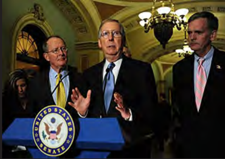
အမေရိကန်အထက်လွှတ်တော်အမတ် Mitch McConnell

မြန်မာစစ်အစိုးရအား စီးပွားရေး ပိတ်ဆို့အရေးယူသည့် ဥပဒေကို ၂၀၀၃ ခုနှစ်မှစတင်ခဲ့ပြီး ဇူလိုင်လ ၂၆ ရက်နေ့ တွင် သက်တမ်းကုန်ဆုံးတော့မည် ဖြစ် သောကြောင့် သုံးနှစ်သက်တမ်း ထပ်မံ တိုးမြှင့်ရန် အမေရိကန် အထက်လွှတ် တော်မှ ဇူလိုင်လ ၂၄ ရက်နေ့တွင် အတည် ပြုလိုက်သည်။ ထိုဥပဒေအား သက်တမ်း တိုးမြှင့်ရန်အဆိုကို အမေရိကန် အောက် လွှတ်တော်တွင် ဇူလိုင်လ ၂၁ ရက်နေ့က အတည်ပြုခဲ့ပြီးနောက် အထက်လွှတ် တော်မှ အတည်ပြုရန် လွှတ်တော်အမတ် မစ်ချဲလ်ကော့နဲလ်နှင့် ဒင်နီနီယယ်လ် ဖိန် စတင်းနီတို့မှ ဦးဆောင်တင်သွင်းခဲ့ခြင်း ဖြစ်သည်။