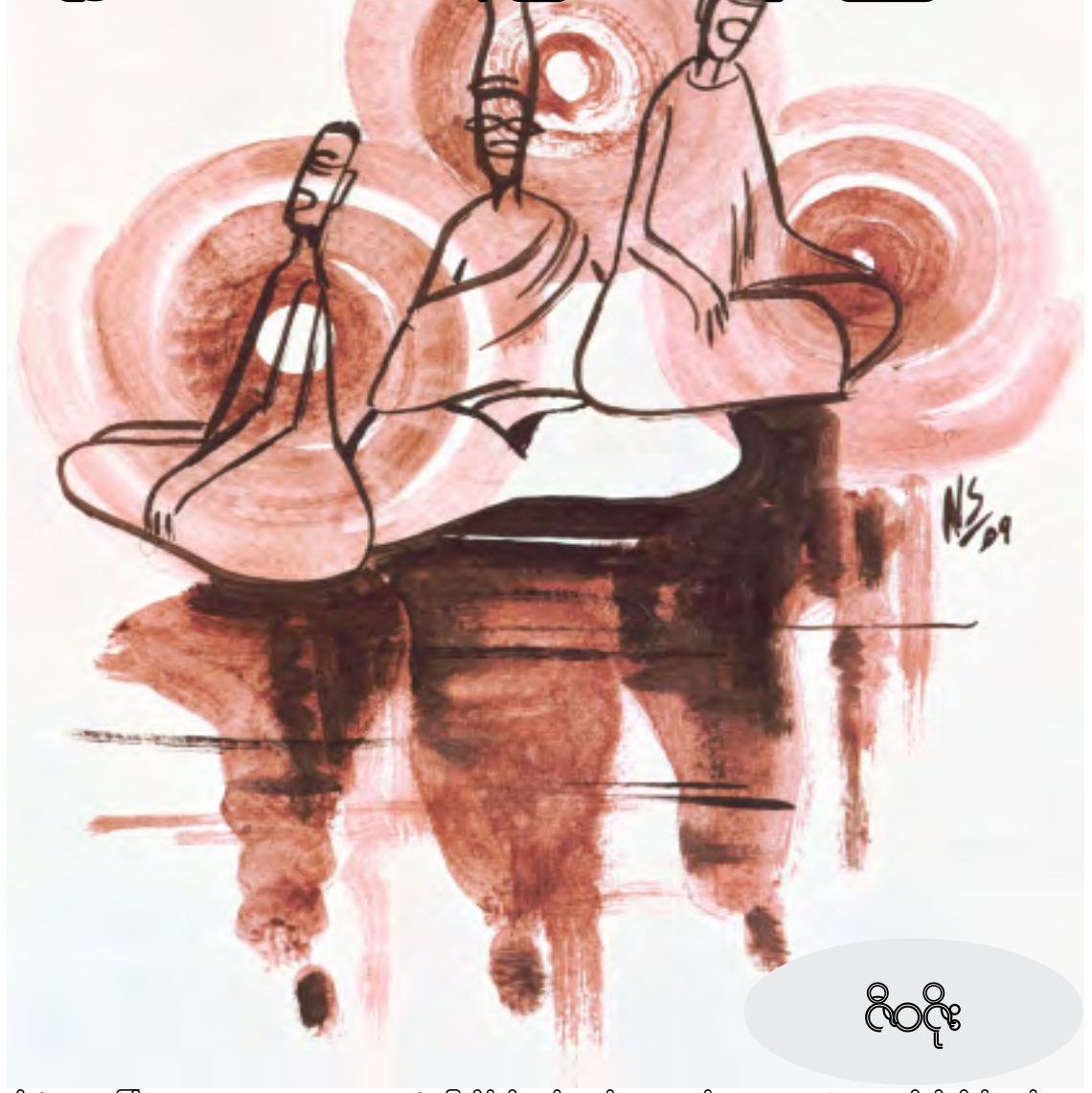
လိဝိုင်း

ပါဘဲ။ ရသေ့ကြီးကတော့ အထူးကုဆရာဝန်ကြီးပေါ့လေ။ ဆေးကုဖို့နည်းနာကို သူဘဲ ဦးဆောင်ရတာကိုး။ ကျနော်တွေးမိတာက သူတို့ဟာ သူတော်ကောင်းတွေ မဟုတ်သလို သူယုတ်မာတွေလည်း မဟုတ်ပါ။ အံ့ဩရတာက ကလေးအသက် ချမ်းသာရာရရှိရေး ဦးတည်ချက်မှာ အားလုံးတူနေကြပြီး မှန်ကန်တဲ့သစ္စာစကားကို ဆိုကြခြင်းပါ။ သည်လို မှန်ကန်တဲ့ သစ္စာဆိုလို့ ကလေးအသက်ချမ်းသာရာရတာ တော့ မှန်ပါတယ်။ အခု အပြောနဲ့ပြောရရင် နောက်ဆက်တွဲအဖြစ် လင်မယားကွဲ