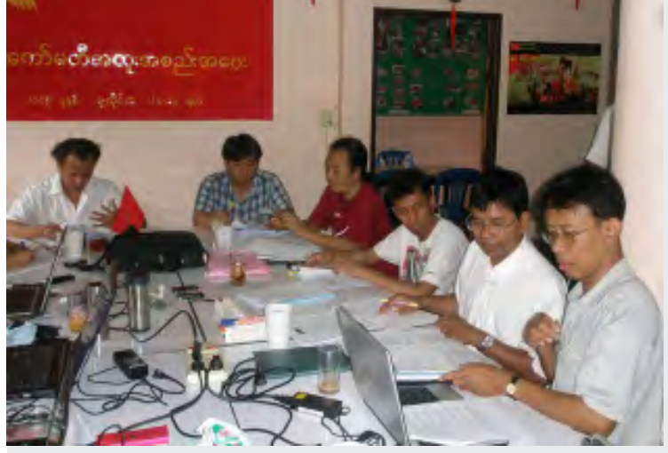
လူ့ဘောင်သစ်ဒီမိုကရက်တစ်ပါတီ ဗဟိုကော်မတီအထူးအစည်းဝေး ကျင်းပနေစဉ်

လူ့ဘောင်သစ်ဒီမိုကရက်တစ်ပါတီ ဗဟိုကော်မတီ၏ အထူးအစည်းဝေးကို ထိုင်း-မြန်မာနယ်စပ်တစ်ခုတွင် ဧပြီလ (၂၀)ရက်နေ့မှ (၂၄)ရက်နေ့အထိ ကျင်းပပြုလုပ်ခဲ့ပြီး လက်ရှိနိုင်ငံရေးဖြစ်စဉ်များအပေါ် ခြုံငုံသုံးသပ်ချက်နှင့် ပါတီလုပ်ငန်းအစီရင်ခံစာအား ဗဟိုအလုပ်အမှုဆောင်ကော်မတီမှ တင်ပြခဲ့ပြီး တက်ရောက်လာကြသော ဗဟိုကော်မတီဝင်