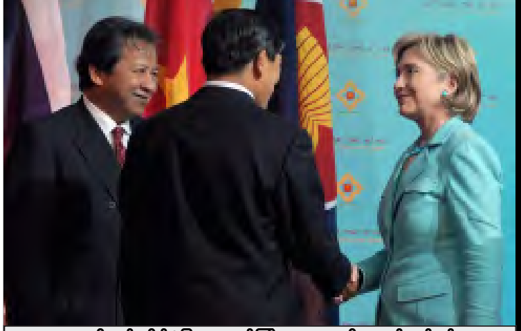
အမေရိကန် နိုင်ငံခြားရေးဝန်ကြီး ဟေလာရီကလင်တန်နှင့် မြန်မာနိုင်ငံခြားရေးဝန်ကြီး ဦးညွှတ်ဝင်းတို့ အာဆီယံနိုင်ငံခြားရေးဝန်ကြီးများ အစည်းအဝေးတွင် တွေ့ဆုံစဉ်

အမေရိကန် နိုင်ငံခြားရေးဝန်ကြီး ဟေလာရီကလင်တန်သည် ထိုင်းနိုင်ငံခြားရေးဝန်ကြီး အဘိဆစ်နှင့် ဇူလိုင်လ (၂၁) ရက်နေ့တွင် တွေ့ဆုံဆွေးနွေးအပြီး မြန်မာနိုင်ငံရေးနှင့် ပတ်သက်၍ အမေရိကန်အစိုးရ၏ ရပ်တည်ချက်အား ရှင်းလင်းပြောကြားရာတွင် မြန်မာနိုင်ငံ၌ တိုင်းရင်းသား လူမျိုးစုများအပေါ် အဓမ္မပြုကျင့်မှုများ အပါအဝင် လူ့အခွင့်အရေး ချိုးဖောက်မှုများအား အလေးထား ပြောကြားသွားသည်။