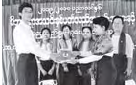
၂၀၁၀ ပညာသင်နှစ် တက္ကသိုလ်ဝင်စာမေးပွဲ အောင်မြင်သူများအား ဆုချီးမြှင့်ပွဲ အခမ်းအနား၌ တက်ရောက်၍ တာဝန်ရှိသူများနှင့်အတူ ဆုများပေးအပ်ခြင်း (၂၅/၇/၁၀)

ထို့နောက် တိုင်းမှူးသည် အပျိုတိုင်းမှူးနှင့် တွေ့ဆုံပွဲအခမ်းအနား၌ တက်ရောက်၍ တာဝန်ရှိသူများနှင့်အတူ ဆုများပေးအပ်ခဲ့ခြင်းဖြစ်သည်။