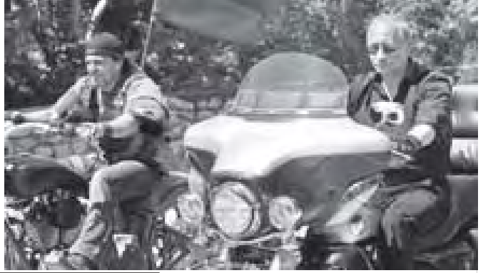
ယူကရိန်းနိုင်ငံ ဆီဗတ်စ်တိုရီမြို့အနီးရှိ ကမ္ဘာတစ်လွှားမှ ဆိုင်ကယ်သမားများ စုရုံးတွေ့ဆုံရာနေရာသို့ ဟာလီဒေပစ်ဆင် ဆိုင်ကယ်စီး၍ ရောက်ရှိလာသော ရုရှားဝန်ကြီးချုပ် ပူတင်ကို ဇူလိုင် ၂၅ ရက်က တွေ့ရစဉ်။