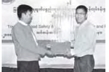
ငါးလုပ်ငန်းဦးစီးဌာန ညွှန်ကြားရေးမှူးချုပ် ဦးခင်ကိုလေး Food Safety & Quality Control of Fish and Fishery Products (1/2010) သင်တန်းဆင်းပွဲတွင် သင်တန်းသားတစ်ဦးအား သင်တန်းဆင်းလက်မှတ်ပေးအပ်ပေးခြင်း (၆/၇/၁၀)

၂၀၁၀ ပညာသင်နှစ် တက္ကသိုလ်ဝင်စာမေးပွဲတွင် ထူးချွန်စွာ အောင်မြင်ခဲ့ကြသည့် ကျောင်းသား၊ ကျောင်းသူများအား ဆုချီးမြှင့်ပွဲ အခမ်းအနားသို့ တက်ရောက်၍ တာဝန်ရှိသူများနှင့်အတူ ဆုများပေးအပ်ခဲ့ခြင်းဖြစ်သည်။