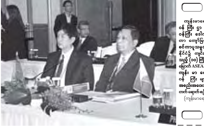
ကျန်းမာရေး ဝန်ကြီးဌာန ဝန်ကြီး ဒေါက်တာကျော်မြင့်၊ စင်ကာပူ သမ္မတနိုင်ငံ၌ ကျင်းပသည့် (၁၀) ကြိမ်မြောက် ASEAN ကျန်းမာရေး ဝန်ကြီးများ အစည်းအဝေးသို့ တက်ရောက်စဉ်။ (ကျန်းမာရေး)

ဝန်ကြီး ဒေါက်တာကျော်မြင့် ခေါင်းဆောင်သော အဖွဲ့သည် ဇူလိုင် ၂၀ ရက် မွန်းလွဲ ၂ နာရီတွင် စင်ကာပူ သမ္မတနိုင်ငံ Shangkai-La တို့တယ်၌ ကျင်းပသည့် အရှေ့အာရှကျန်းမာရေး ခိုင်ရာမျိုးပွားဆွေးနွေးပွဲသို့ တက်ရောက်သည်။ ဆွေးနွေးပွဲတွင် စင်ကာပူသမ္မတနိုင်ငံ ကျန်းမာရေးဝန်ကြီး Mr. Khaw Boon Wan က အဖွဲ့အမှူးအဖွဲ့ဝင်အဖြစ် ပါဝင်ဆောင်ရွက်ခဲ့သည်။