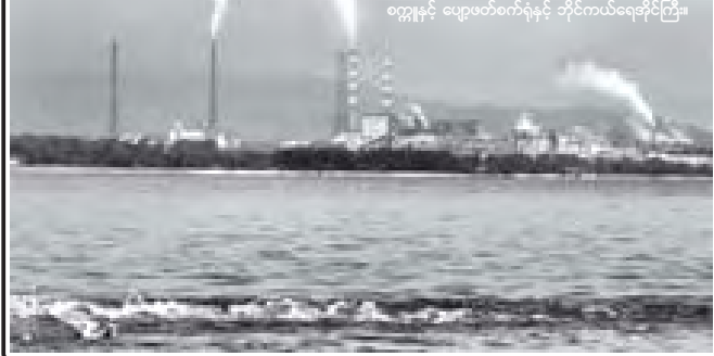
ရွာနှင့် ပျော့ပတ်စက်ရုံနှင့် ဘိုင်းကယ်ရေအိုင်ကြီး။

အာဖဂန်အစိုးရနှင့် နိုင်ငံတကာအသိုင်းအဝိုင်းအကြား ပြုလုပ်ခဲ့တဲ့ သမိုင်းဝင် ကဘူးညီလာခံကြီးကို မဟာမိတ်များနှင့် အာဖဂန်အစိုးရတို့ရဲ့ နှိုးနှိုမှုပေးလှူဒါန်းမှု အမည်တင်ကြပါတယ်။